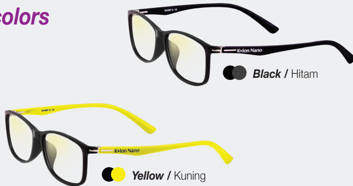
Black / Hitam