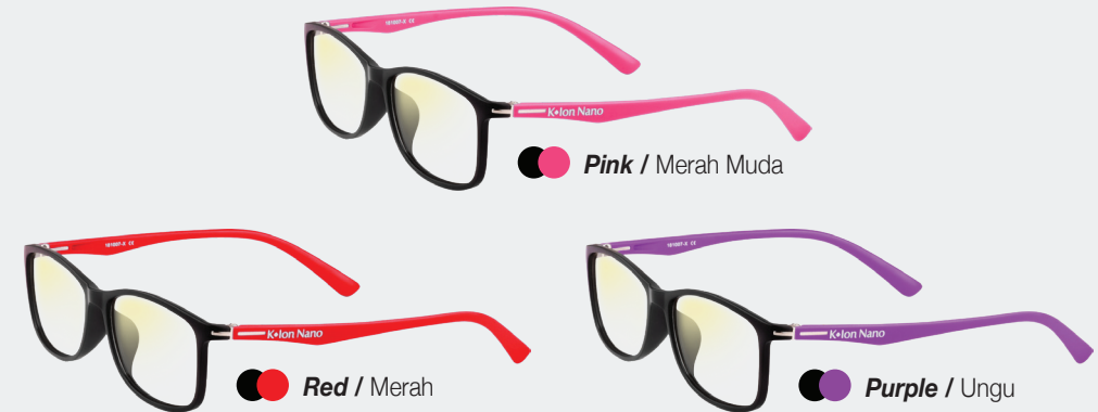
Pink / Merah Muda