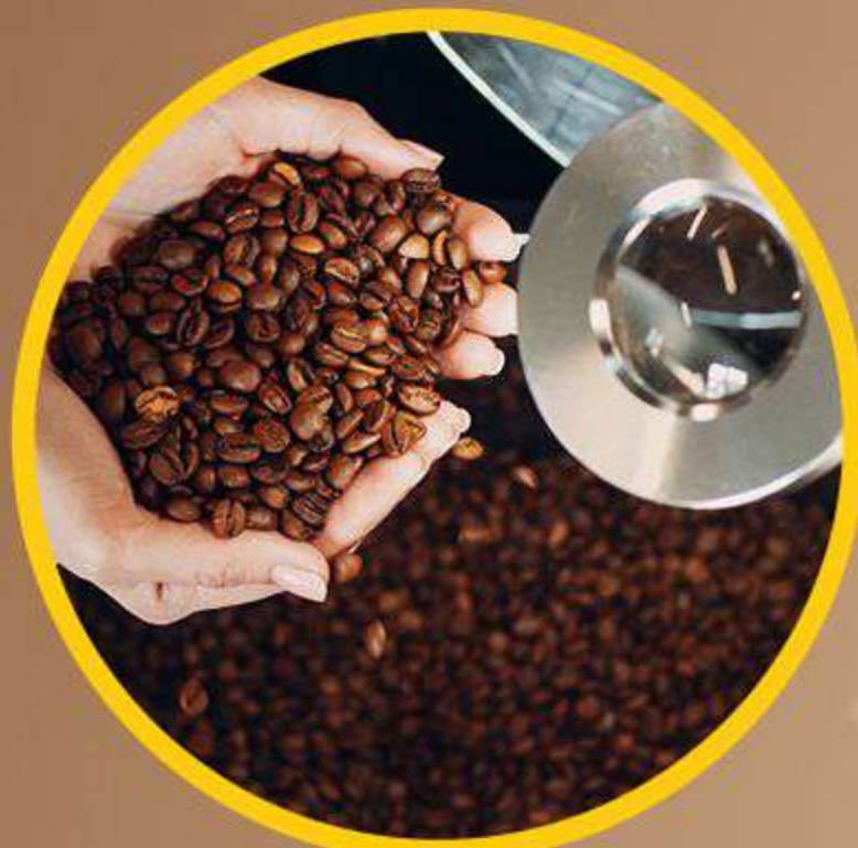
Kopi Arabica Pilihan